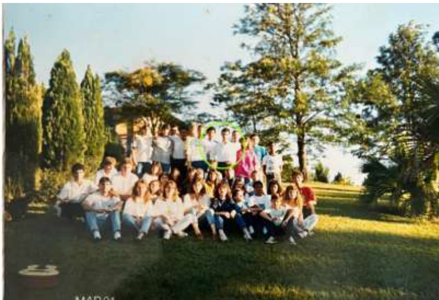
Retiro de Jovens - Mosteiro de São Bento - Vinhedo Siloé - Março/1991

Mas uma ruptura profunda estava prestes a acontecer.