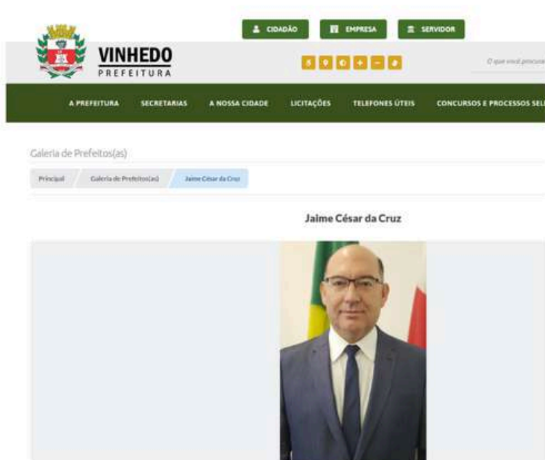
Site da Prefeitura Municipal de Vinhedo Galeria de Prefeitos