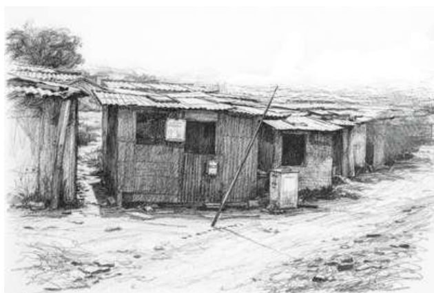
Ilustração Favela Jardim Três Irmãos - Vinhedo/SP