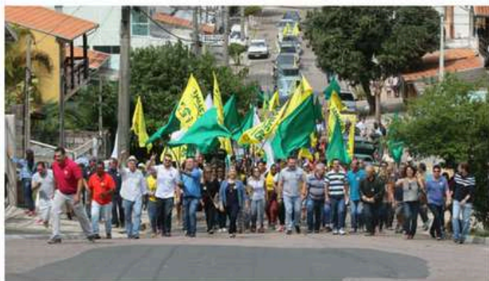
Atividades e Caminhadas nas eleições de 2016