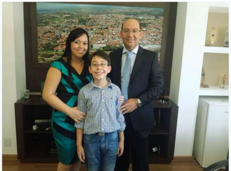
Posse Prefeito de Vinhedo - 29/03/2014

Posse como Prefeito Municipal de Vinhedo.