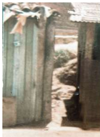
Barraco 27-C, Jardim Três Irmãos — primeiro endereço da família em Vinhedo