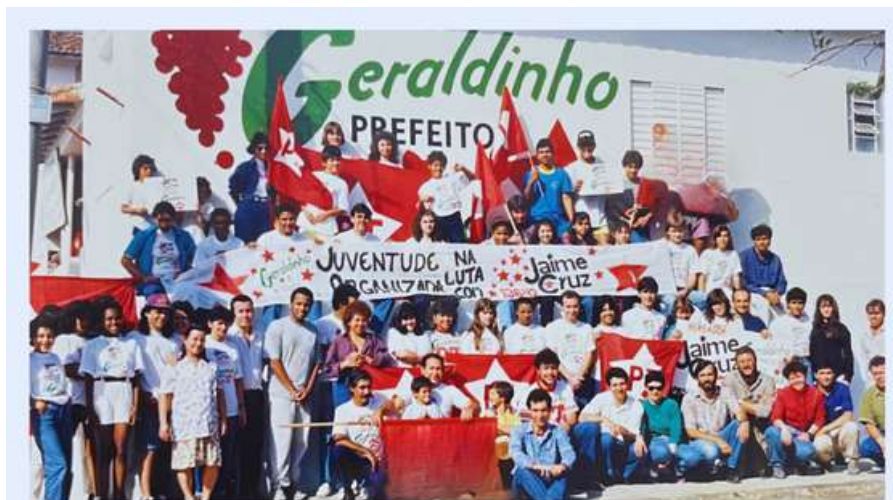
Campanha de 1992. Construída com apoio familiar e comunitário.

A campanha foi artesanal. E, justamente por isso, autêntica.