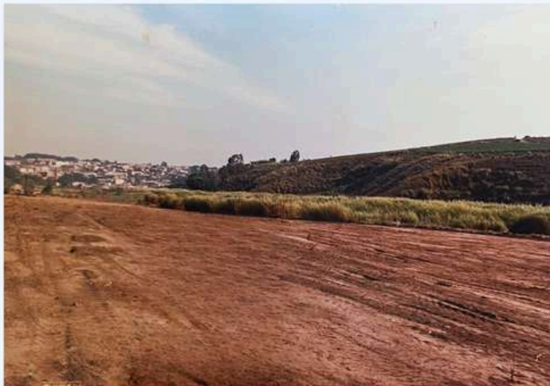
Jardim Nova Canudos - 1991