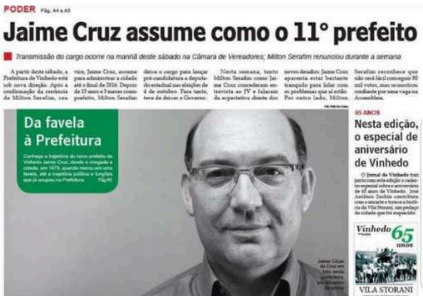
“Da favela à Prefeitura” A frase já resume toda sua caminhada

Representava o início do maior desafio institucional de sua trajetória.